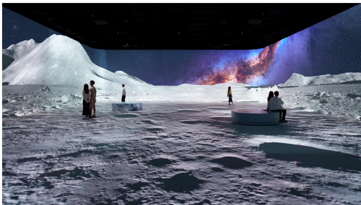
Illuminarium幻影空间带领观众360度探索宇宙