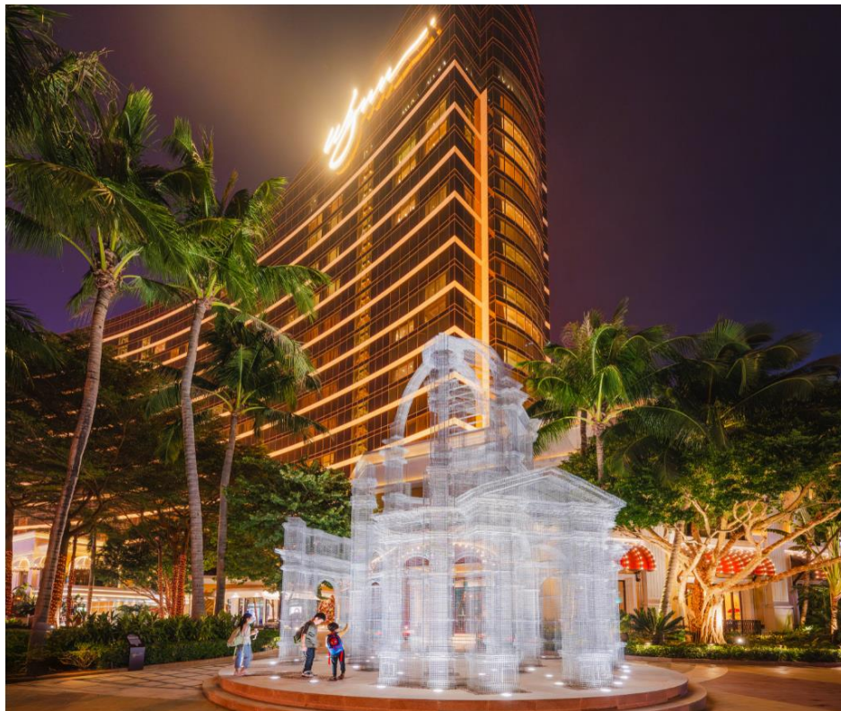
艾杜雅多·特雷索迪最引人矚目的作品之一《縈思》