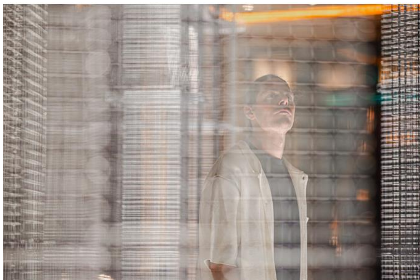
國際藝術大師艾杜雅多·特雷索迪