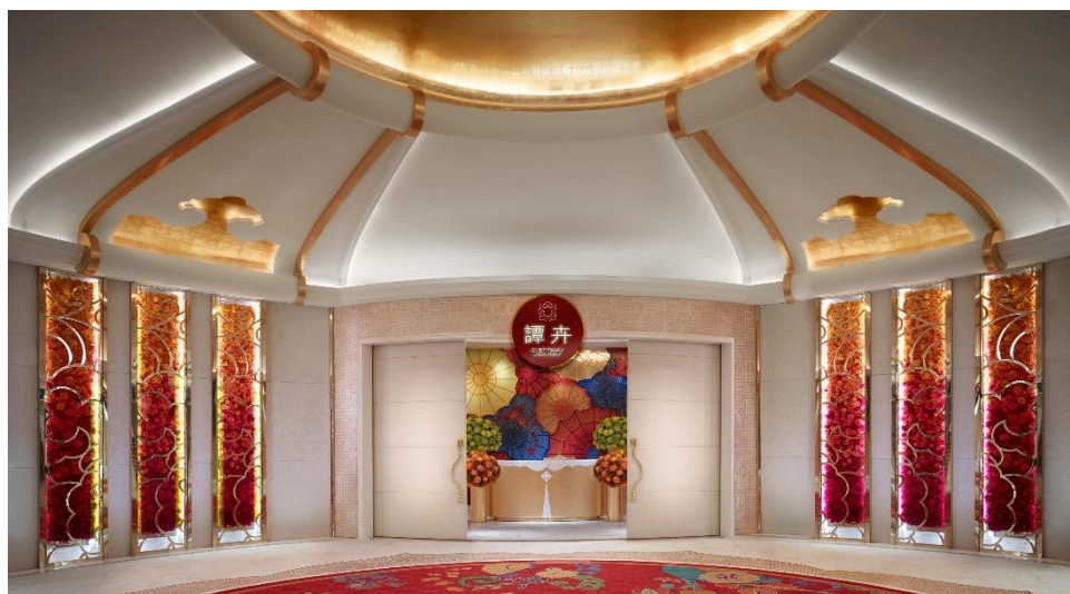
“最佳中餐厅” — 譚卉