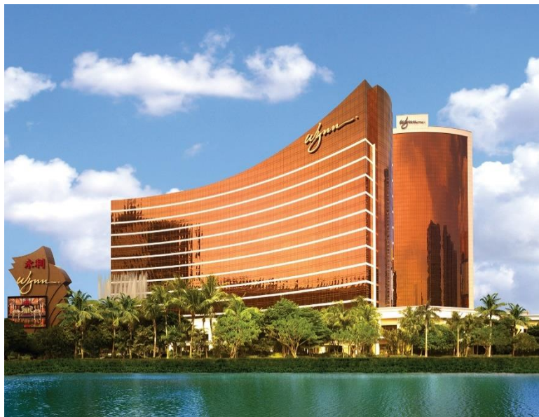
“年度最佳度假酒店” — 永利澳门