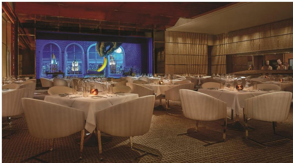
“最佳牛扒餐厅” — 永利扒房