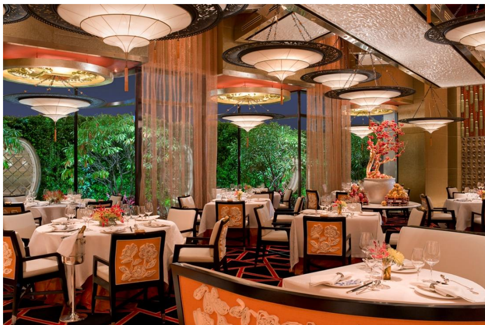
京花轩同时获颁“年度人气餐厅”和“最佳中餐厅”