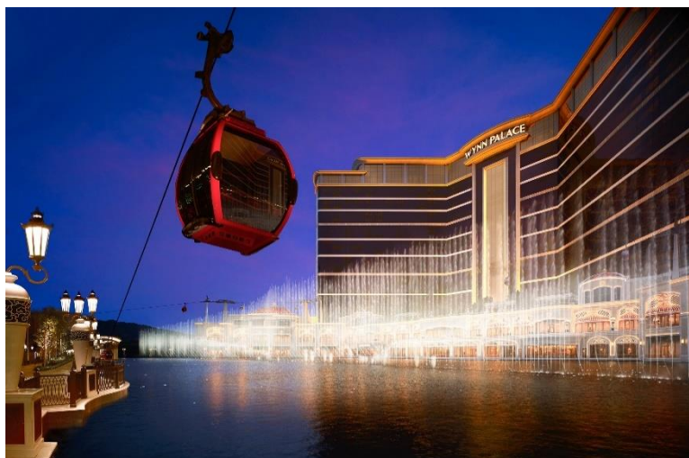
永利皇宮荣获“年度最佳度假酒店”及“年度人气酒店”两个大奖