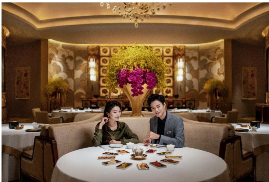
圖一：永利星級食府隆重呈獻「美食家之旅」星級禮遇