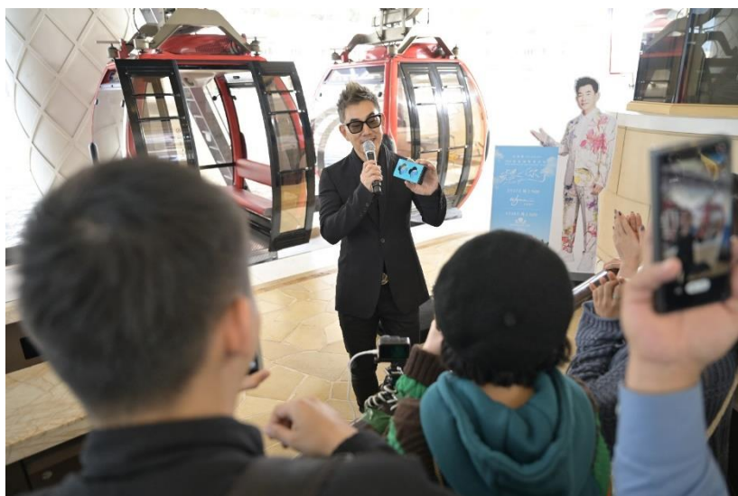
任賢齊現身永利皇宮觀光纜車站進行快閃活動，吸引不少民眾圍觀