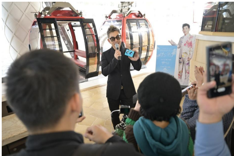
任贤齐现身永利皇宮观光缆车站进行快闪活动，吸引不少民众围观