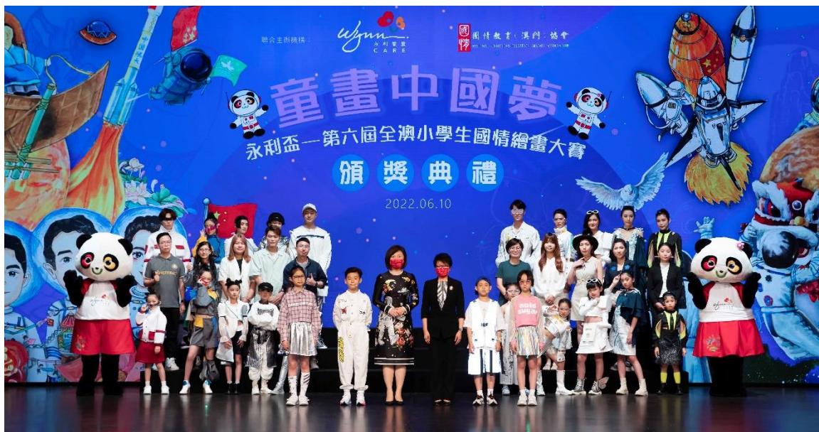
永利與澳門生產力暨科技轉移中心合辦以「太空遨遊」為題的時尚匯演