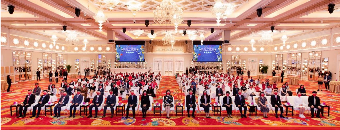
「永利盃——第六屆全澳小學生國情繪畫大賽」假永利皇宮舉辦頒獎典禮