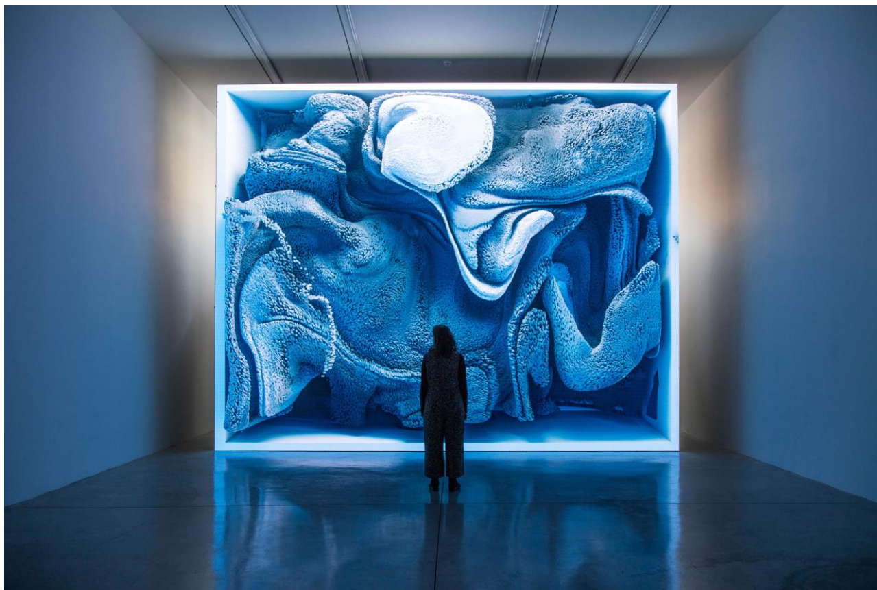
拉菲克·安納度 (Refik Anadol)