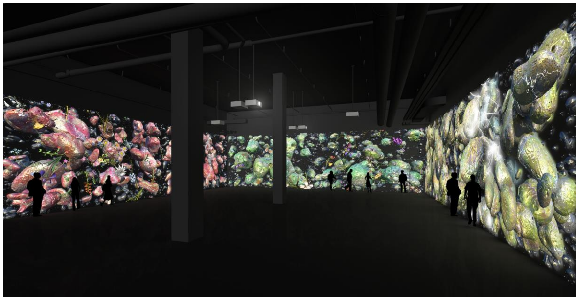
珍妮弗·施丹琴 (Jennifer Steinkamp)