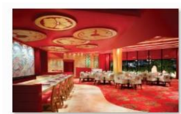
2: 永利澳門 - 「泓」日本料理