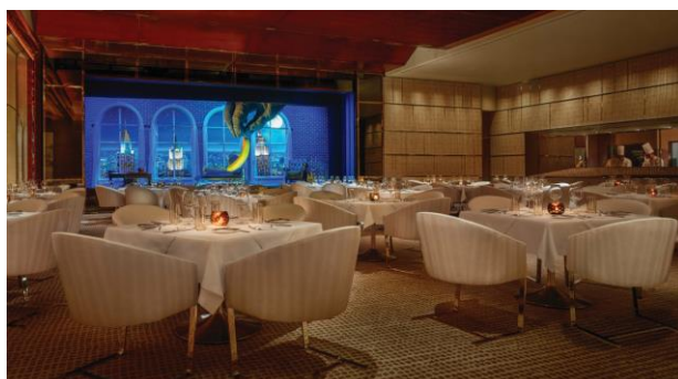
3: 永利皇宮 - 永利扒房