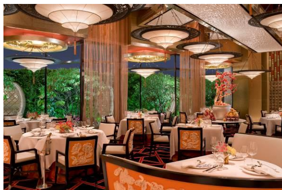
1: 永利澳門 - 京花軒