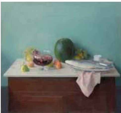
María Moreno. Naturaleza muerta de la sandía , 1990. Colección privada