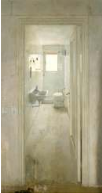
Antonio López. El cuarto de baño , 1966. Colección privada

espejo (1967) o Taza de váter y ventana (1968-1971); de Amalia Avia, El comedor (1987), y de Isabel Quintanilla, El teléfono (1996) o Habitación de costura (1974).