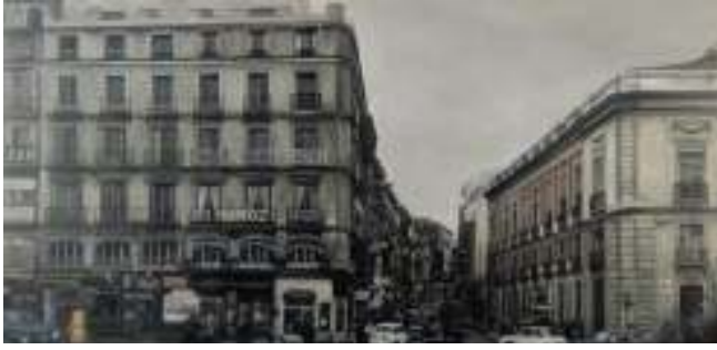
Amalia Avia. Puerta del Sol , 1979. Colección AENA de arte contemporáneo

La parte final del recorrido, en la que se prolonga la presencia de la escultura con la obra de Francisco López, está dedicada a las vistas urbanas, con las que salimos definitivamente al exterior para recorrer los rincones y calles de la ciudad, principalmente de Madrid; unas obras que se convierten a lo largo de los años en testimonio de la