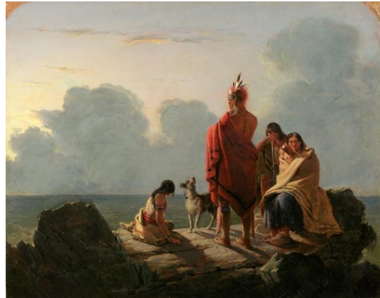
Tompkins Harrison Matteson. El último de su raza , 1847.

los Viajes en el interior de Norteamérica , del antropólogo Maximilian zu Wied-Neuwied, nos permiten conocer en profundidad los campamentos indios, la caza del búfalo y los rituales de numerosas tribus, así como fisonomías y atuendos. Ellos dieron paso a una visión idealizada pero melancólica de la vida india, en la que se funden paisaje y figuras, fantasía y etnografía. En la segunda mitad del siglo, estos temas ya se habían convertido en un subgénero pictórico con gran tirón popular, asociado a la pintura de historia o a la costumbrista y presente en la producción de artistas como Charles M. Russell, Charles Wimar y Frederic Remington, entre otros.