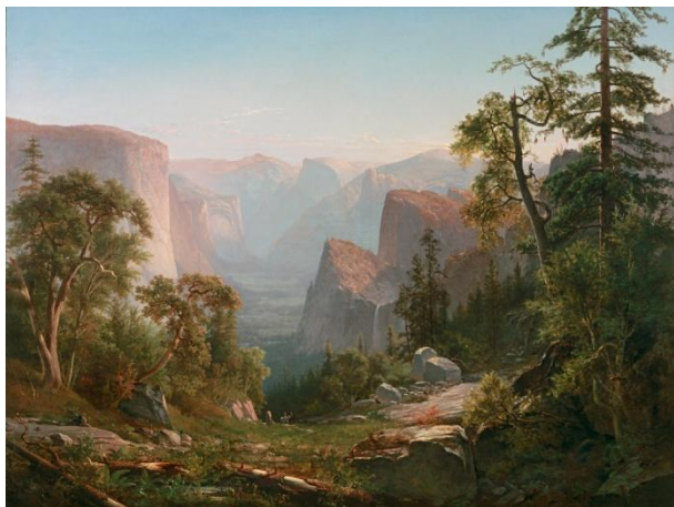
Thomas Hill. Vista del Valle de Yosemite , 1865.

Los caminos hacia el Oeste fueron abiertos por tramperos y compañías de comercio de pieles y, después, por científicos y militares que realizaron largos recorridos y que, desde muy pronto, se hicieron acompañar por artistas que ilustraran sus hallazgos o, con mayor ambición artística, pintaran o fotografiaran los paisajes y sus pobladores originales. El ferrocarril facilitó el acceso a una naturaleza “edénica” –pronto también turística– que, con gran ayuda de los artistas, pasaría a ser protegida a través del innovador sistema de parques nacionales. Yosemite, Yellowstone y el Gran Cañón son algunos de los escenarios representados en la exposición.