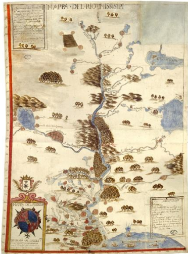
Anónimo. Mapa del Río Misisipi, dedicado al duque de Jovenazo por su servidor don Armando de Arce, barón de Lahontan, 1699. Archivo General de Indias. Sevilla

etnográficos que se distribuyen a lo largo del recorrido, así como un conjunto de libros, cómics, carteles de cine y otros elementos que mostrarán la divulgación que han tenido en el siglo XX las leyendas sobre el Lejano Oeste. Por último, Miguel Angel Blanco, artista y comisario de la exposición, interesado desde hace años en la cultura india, presenta una selección de libros-caja de su Biblioteca del Bosque , realizados con materiales que ha recogido en sus viajes por las llanuras y cañones de Estados Unidos.