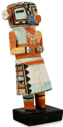
Muñeca kachina hopi, c. 1900-1940. Museo Nacional de Antropología, Madrid.

posible los restos de ese desmoronamiento, iniciando unas colecciones que han llegado hasta nuestros días. Una selección de trajes, objetos cotidianos y rituales, armas y adornos de las culturas nativas se expondrán a lo largo del recorrido de la exposición, ilustrando algunos detalles de la forma de vida de las tribus.