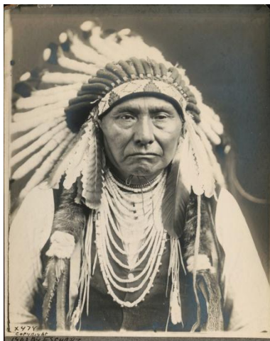
Edward S. Curtis. Joseph. Nez Percé, 1903.

La figura del jefe indio fascinó a cuantos pintores y fotógrafos tuvieron ocasión de observarlos. En estos cuadros y fotografías se muestran con detalle los tocados, las pinturas corporales o los objetos de poder que porta cada uno de ellos. Por primera vez en España, podrán verse los famosos retratos realizados por Bodmer y Catlin o las fotografías de jefes legendarios salidas de las cámaras de Adolph Muhr o Edward S. Curtis, tomadas años más tarde.