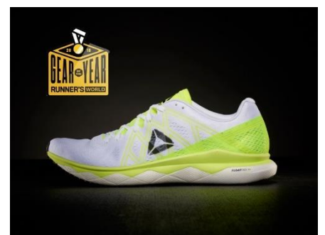
※“Gear of the Year 賞”を獲得した Floatridefast

リーボック初のレーシングシューズであり、このフォーム材を取り入れ、最軽量化を目指した「Floatriderunfast Pro」は国内で2018年7月に限定発売され1週間で完売するなど人気を博しました。同じく「FLOATRIDE FOAM」を採用した「Floatridefast」は世界で権威のあるランニング雑誌『Runner's World』にて2018年度の“Gear of the Year 賞”に選出されています。