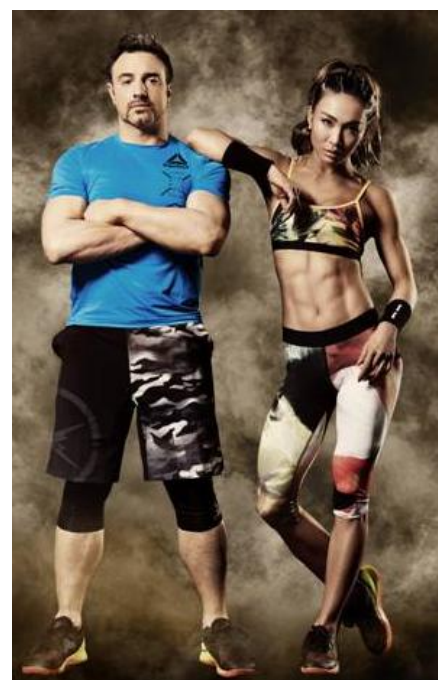
リーボック スパルタンレース 推奨コーディネート

リーボックは、“Be More Human 人間をきわめろ”というブランドメッセージのもと、日本中の人たちに向けてフィットネスに対する捉え方や体験を変革することを目指したさまざまな取り組みを行っています。「リーボック スパルタンレース」で経験する「走る、跳ぶ、登る、汗をかく」といった人間本来の姿を通し、自らの可能性を最大限に高め、成長していく全ての人たちをサポートしていきます。