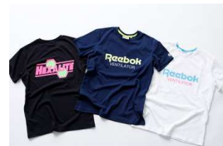
CVT90 TEE HXL LOGO