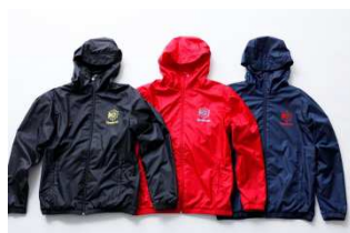
CRR80 FULL ZIP WIND JACKET