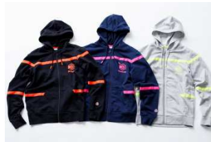
CVT90 FZ HOODY