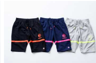
CVT90 SWEAT HALF PANT