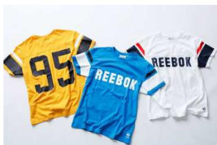
CRR80 TEE B95