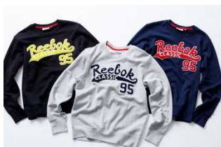
CRR80 CREW NECK SWEAT