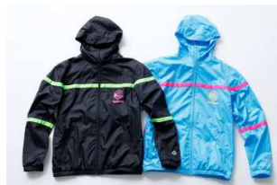
CVT90 WIND JACKET