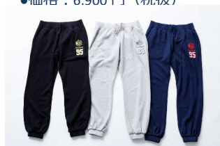
CRR80 SWEAT PANT