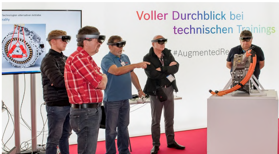
Augmented Reality Workshop auf der Automechanika Frankfurt

Praxisorientierte Workshops sind seit Jahren fester Bestandteil der Automechanika. Die zunehmende Digitalisierung und neue technologische Entwicklungen stellen viele Werkstätten vor große Herausforderungen. Um Schritt halten zu können, sind regelmäßige Weiterbildungen notwendig. Die Automechanika Frankfurt bietet dafür in Kooperation mit namhaften Partnern praxisorientierte Workshops in Deutsch und Englisch an, die Kfz- und Nfz-Profis zeigen, worauf es ankommt.