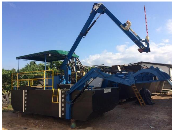
Trator aquático Trackmar, da Gasparmar

“Estamos satisfeitos tanto com o motor FPT, quanto com o respaldo da revendedora da marca. Tivemos todo o apoio necessário e, mesmo após o negócio fechado, o motor não p recisando de manutenção contínua, dirimimos todas as nossas dúvidas, contando com a presença do consultor e uma boa equipe que dá sustentação. Este primeiro motor FPT nos tornou cliente da marca e da Forza JMalucelli”, afirma a Gasparmar.