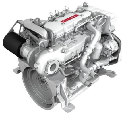
菲亚特动力科技 N40 250 E 龙骨冷却系统

作为“畅游虚拟水上世界”的第二大亮点，菲亚特动力科技展示了在 N40 250 E、N67 450 N 和 N67 570 EVO 上采用的龙骨冷却系统。菲亚特动力科技优化发动机的布局，并通过推出的这种特殊的冷却系统，充分证明了自己对在棕水区域和浅滩涂作业的客户关注，避免有关海水冷却系统的常见问题。