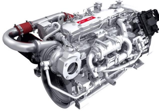
菲亚特动力科技 N67 570 E 龙骨冷却系统