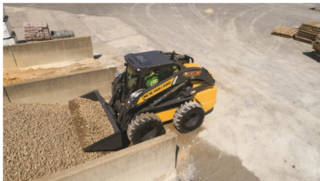
New Holland L330