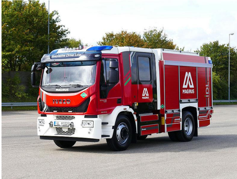
Camión Magirus Compact Class equipado con motor FPT N60 NG