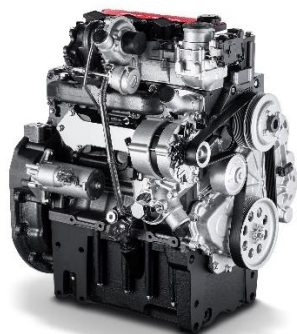
FPT Industrial F28 Natural Gas