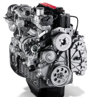
FPT Industrial F28 Diesel

Cette année, le jury international a sélectionné le moteur F28 pour son melting-pot de caractéristiques gagnantes : compacité, rendement et respect de l'environnement. Compact, ce moteur est la solution parfaite pour le matériel agricole, y compris les tracteurs spécialisés et les petits tracteurs utilitaires, ainsi que pour les machines légères pour la construction, comme les chargeuses compactes et les chargeuses compactes sur pneus.