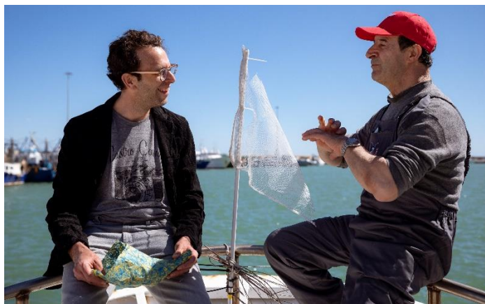
L'artista Christian Holstad (a sinistra) dialoga con un pescatore del progetto "A pesca di plastica"

Ma l'impegno di FPT Industrial non si ferma qui. Il Brand ha infatti sostenuto l'opera d'arte di Christian Holstad, "Consider yourself as a guest (Cornucopia)" , che verrà presentata durante la Biennale Internazionale d'Arte di Venezia . Per lo sviluppo di questa installazione site specific, l'artista si è ispirato alle continue notizie sul crescente inquinamento dei mari e degli oceani di tutto il mondo e alle testimonianze dirette dei pescatori di San Benedetto del Tronto. Come simbolo del loro impegno, i pescatori hanno regalato a Christian Holstad una rete da pesca, che l'artista utilizzerà nella propria opera d'arte. L'installazione ricorda una cornucopia, simbolo antico di fortuna e di abbondanza , prodotta interamente con rifiuti plastici , che diventa l'occasione per riflettere sull'urgenza di affrontare il tema dell'inquinamento dei nostri mari. Il significato classico di questa immagine iconica viene così stravolto dall'artista, acquisendo un inedito senso negativo di "eccesso" , mentre la stretta relazione tra l'opera e l'acqua, mira a sensibilizzare il pubblico in modo chiaro e immediato, letteralmente "portando a galla" un problema di assoluta attualità, non lasciandolo nascosto nei fondali del mare.