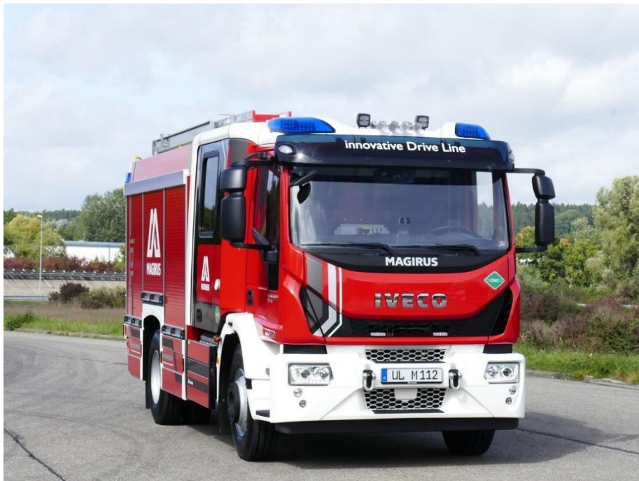
Il veicolo antincendio Magirus equipaggiato con il motore N60 NG di FPT Industrial

bombole per 420 litri di gas naturale compresso (CNG). Il veicolo ha un'autonomia fino a 300 km di percorrenza o fino a 4 ore di funzionamento della pompa. L'impianto a gas è conforme a tutte le più recenti e severe norme di sicurezza e il motore a gas naturale offre notevoli vantaggi in termini di riduzione delle emissioni di NOx e CO 2 . Il design del veicolo antincendio rafforza le sue caratteristiche di sostenibilità, ad esempio usando il gas naturale anche per l'impianto di riscaldamento della cabina, integrando un generatore di idrogeno, ventilatori e altri dispositivi di soccorso alimentati a batteria.