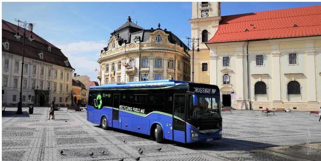
IVECO BUS Crossway Natural Power

O Prêmio de Ônibus Sustentável avalia uma série de critérios de sustentabilidade, como conforto, níveis de ruído, segurança e o compromisso geral do fabricante com a sustentabilidade. O júri é composto por representantes das principais revistas europeias do setor de ônibus.