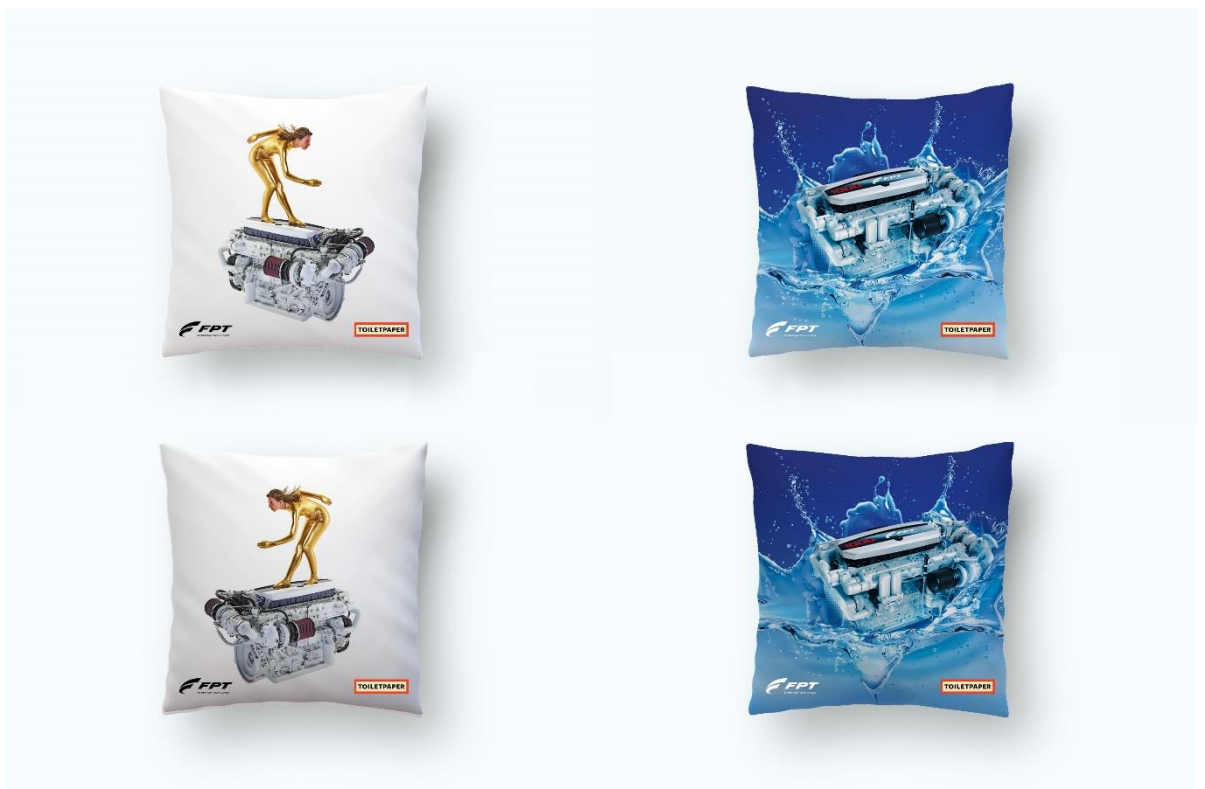
Einige der Kissen der Capsule Collection von Seletti

Farbenfroh, innovativ und einzigartig: Mit diesen Objekten beschreitet FPT Industrial ganz neue künstlerische Wege. Durch die einerseits frechen, gleichzeitig aber piffigen und oft tiefgründigen Bilder der Toiletpaper-Geschäftspartner Maurizio Cattelan und Pierpaolo Ferrari, gelingt es dem Unternehmen zu zeigen, dass technische Innovationen auch in einem Bereich