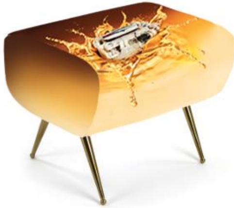
Ein Hocker aus der Capsule Collection