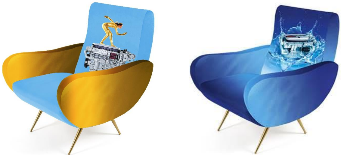
Einige der Sessel aus der Capsule Collection von Seletti

Seit Jahren arbeiten Cattelan und Ferrari auch mit der italienischen Designmarke Seletti zusammen. Nun sind einige ganz neue Designobjekte entstanden, die die Besonderheiten von Seletti ebenso wie die Vorzüge der technologischen Produkte von FPT Industrial herausstellen: Seletti produzierte eine Capsule Collection, bei der die Fotos, die ToiletPaper für FPT Industrial aufnahm, auf unterschiedlichen Alltagsgegenständen verewigt wurden. Die Kissen dieser Sonderkollektion können ab Ende September über den FPT-Online-Shop bestellt werden.