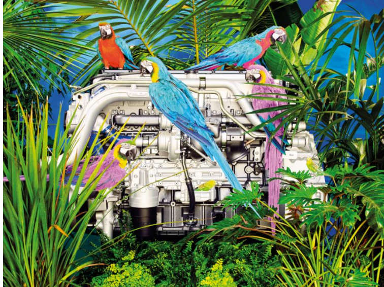
Le Cursor 13 au gaz naturel mis en valeur dans un environnement durable par Toiletpaper

Maurizio Cattelan et Pierpaolo Ferrari expliquent : « Nous avons toujours été charmés par la puissance et la forme des systèmes de transmission de manière générale. Lorsque FPT nous a approchés pour nous proposer de représenter librement deux de ses moteurs les plus puissants et les plus durables, nous avons relevé ce défi à la fois unique et très amusant. À travers le regard surréaliste de Toiletpaper, les moteurs de FPT prennent vie : Toiletpaper saisit leur âme et les transcende, en leur offrant un rôle central dans notre monde ».