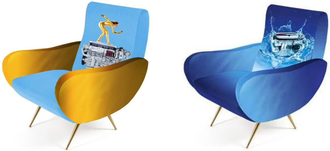
Fauteuils de la collection capsule par Seletti

en objets du quotidien. Les coussins issus de cette collection spéciale seront disponibles à la vente dans la boutique en ligne de FPT Industrial à partir de la fin du mois de septembre.