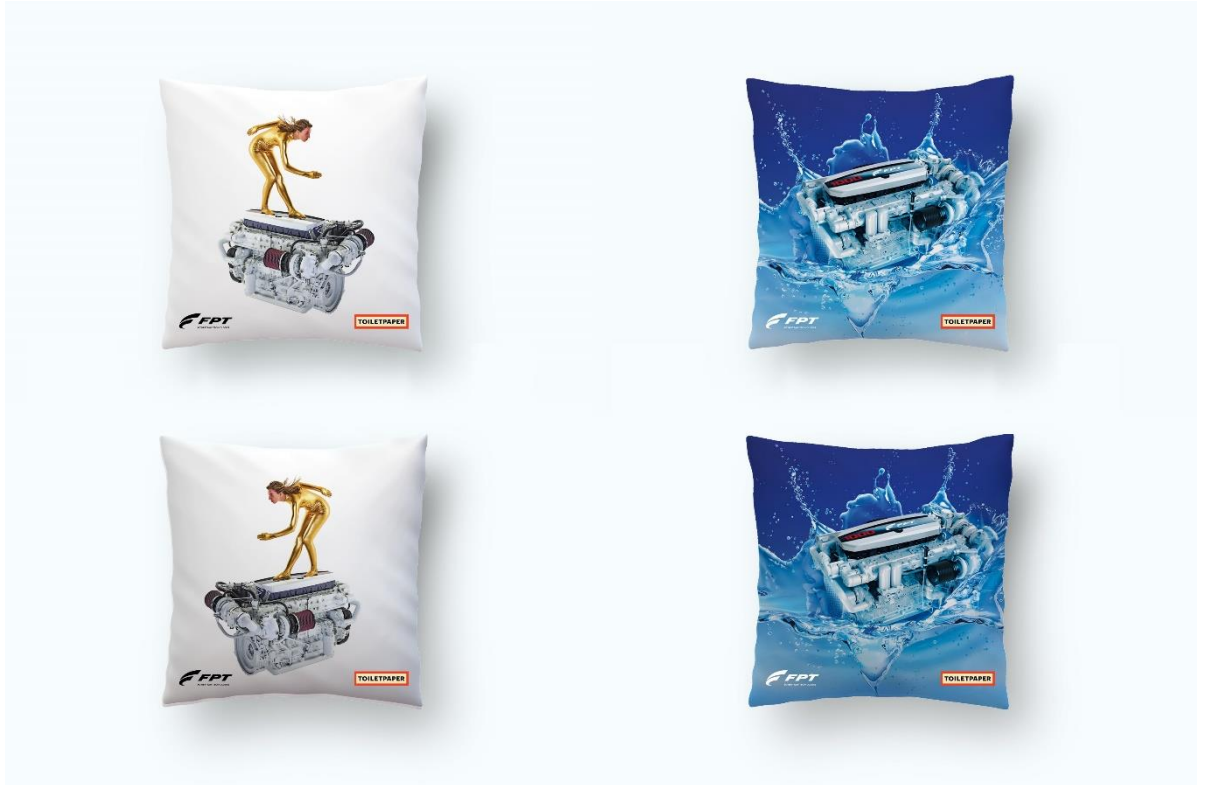
Coussins de la collection capsule par Seletti

Colorés, innovants, uniques : ces objets représentent une nouvelle orientation pour FPT Industrial, qui poursuit son incursion dans le monde de l'art, considérablement éloigné des codes de son environnement industriel naturel. En choisissant de travailler avec des partenaires sachant manier l'irrévérence avec intelligence et profondeur, comme les créateurs de Toiletpaper, Maurizio Cattelan et Pierpaolo Ferrari, FPT Industrial insuffle des idées innovantes au sein de la marque.