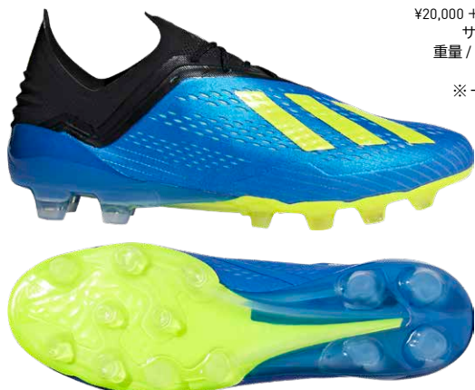
土・ロングパイル人工芝グラウンド対応 商品番号 AP9937 / フットボールブルー×ソーラーイエロー×コアブラック

エックス 18.1-ジャパン HG/AG ¥20,000 +税 (自店販売価格) サイズ / 24.5~29.5cm 重量 / 222g (27.0cm片足) 5月31日発売予定 ※一部店舗のみ取扱い