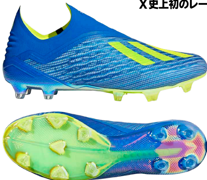
商品番号 CM8358 / フットボールブルー×ソーラーイエロー×コアブラック