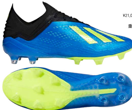
天然芝・ロングパイル人工芝グラウンド対応 商品番号 CM8365 / フットボールブルー×ソーラーイエロー×コアブラック

エックス 18.1 FG/AG ¥21,000 +税 (自店販売価格) サイズ / 24.5~29.5cm 重量 / 197g (27.0cm片足) 5月31日発売予定 ※一部店舗のみ取扱い