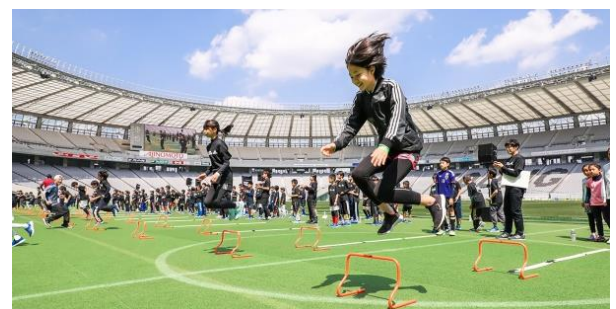
▲「アディダス チャレンジ 二子玉川」イメージ