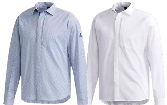
商品番号 CX3410 / カレッジネイビー