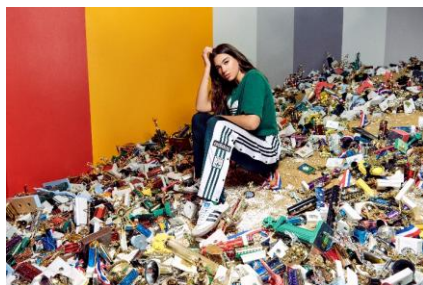
Dua Lipa (デュア・リパ) シンガーソングライター 着用モデル : adicolor