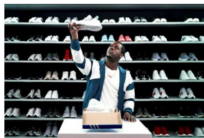
A$AP Ferg (エイサップ・ファーグ) ヒップホップアーティスト 着用モデル : EQT BASK ADV