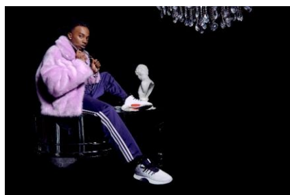
Playboi Carti (プレイボーイ・カルティ) ラッパー 着用モデル : Crazy 1 ADV