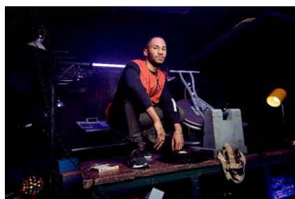
Kaytranada (ケイトラナダ) 音楽プロデューサー 着用モデル : NMD_R1 STLT PK