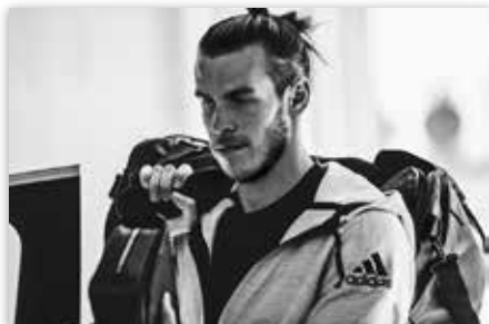
Gareth Frank Bale

「Z.N.E. Hoodie Primeknit」は、アディダス直営店、アディダスオンラインショップ ( http://shop.adidas.jp/athletics/zne/ ) ほか アディダス商品取り扱い店舗にて 2018年1月中旬より順次販売予定となります。