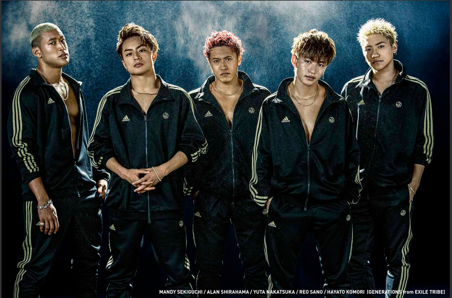
MANDY SEKIGUCHI / ALAN SHIRAHAMA / YUTA NAKATSUKA / REO SANO / HAYATO KOMORI (GENERATIONS from EXILE TRIBE)