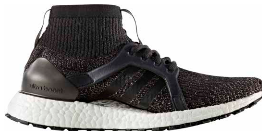
商品番号 CG3009 / コアブラック × コアブラック × テックラストメット

ウルトラブースト エックス オールテレイン リミテッド ¥24,000 +税 サイズ / 23.5 ~ 25.0cm