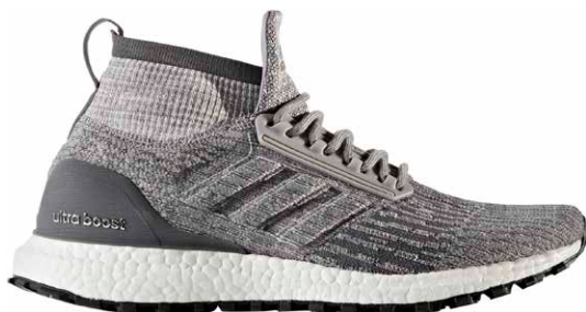
商品番号 CG3000 / グレースリー × グレースリー × グレーフォア