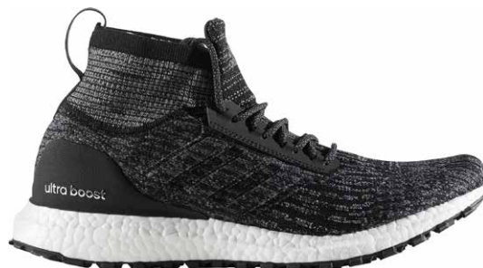
商品番号 S82036 / コアブラック × コアブラック × グレーファイブ F17