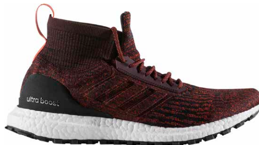
商品番号 S82035 / ダークバーガンディ × ダークバーガンディ × エナジー

ウルトラブースト オールテレイン ¥24000 +税 サイズ / 23.5 ~ 31.0cm