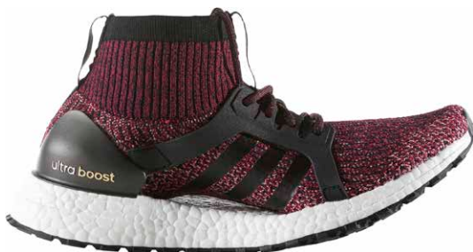
商品番号 BY1678 / ミステリールビー × コアブラック × トレースピンク

ウルトラブースト エックス オールテレイン ¥22,000 +税 サイズ / 22.5 ~ 26.0cm