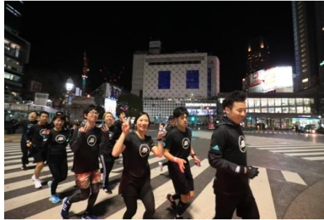
余裕のポーズを決めるランナーも