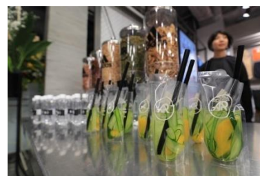
adidas Runners of Tokyo 特製ドリンク