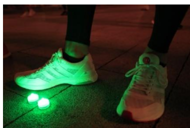
adizero Japan boost 3