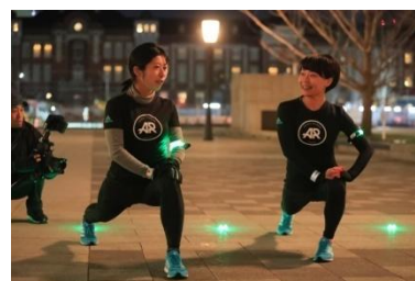
入念なストレッチを実施