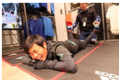
BCS 原宿ではランナーをアフターケア