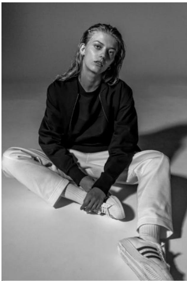
BK2306 TRACKTOP 12,000 円+ 税(自店販売価格) BK2297 TEE 5,490 円+ 税(自店販売価格) BK2289 SWEATPANTS 10,000 円+ 税(自店販売価格)