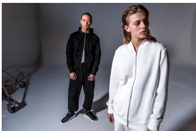
BQ3087 PULLOVER HOODIE 12,000 円+ 税(自店販売価格) BQ3054 SS TEE 5,990 円+ 税(自店販売価格) BQ3103 7/8 SWEATPANTS 10,000 円+ 税(自店販売価格) BK2309 TRACK TOP 12,000 円+ 税(自店販売価格)) BK2289 SWEATPANTS 10,000 円+ 税(自店販売価格)