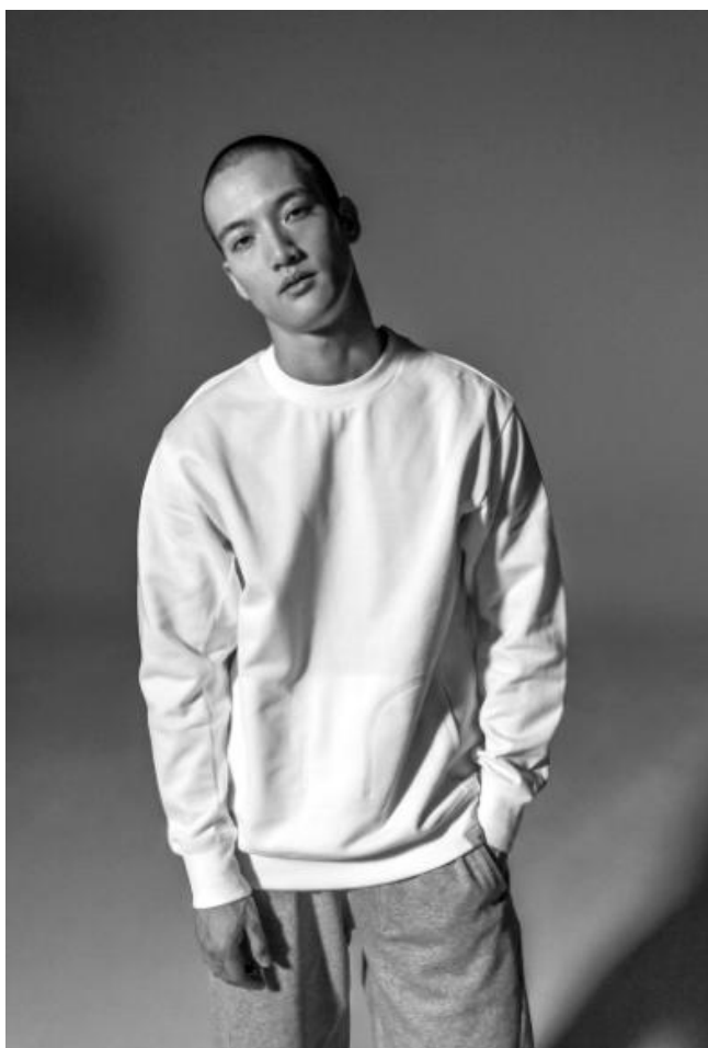
BQ3083 CREW SWEATSHIRT 11,000 円+ 税(自店販売価格) BQ3100 7/8 SWEATPANTS 10,000 円+ 税(自店販売価格)