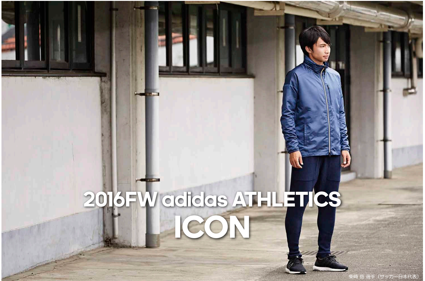
柴崎 岳 選手 (サッカー-日本代表)

ファッションに敏感な都会で暮らす現代のアスリートのためのプレミアム スポーツウェア コレクション “UNITED ARROWS & SONS”との コラボレーションモデルも登場