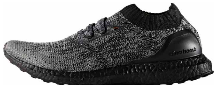
商品番号 BB4679 / コアブラック x ソリッドグレイ x ゴールドメット