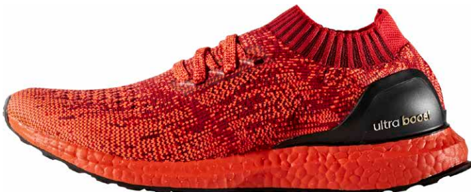
商品番号 BB4678 / スカーレット x ソーラーレッド x コアブラック

ウルトラブースト アンケージド リミテッド CL ¥20,990 + 税 サイズ / 22.0 ~ 31.0cm