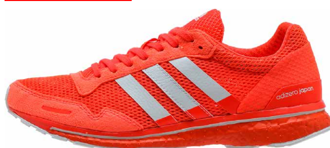
商品番号 BB4902 / ソーラーレッド × ランニングホワイト × ソーラーレッド