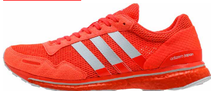
商品番号 BB4903 / ソーラーレッド × ランニングホワイト × ソーラーレッド