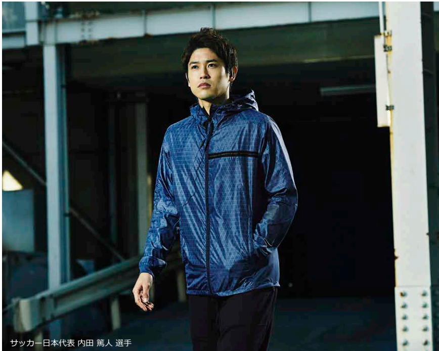
サッカー日本代表 内田 篤人 選手