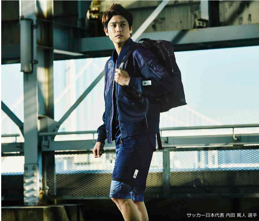
サッカー日本代表 内田 篤人 選手