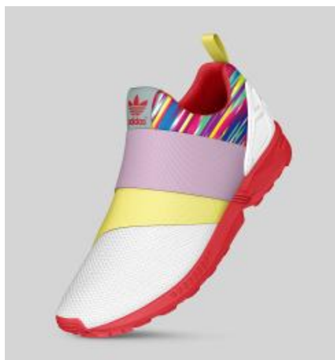
※シューズのカスタマイズ例

商 品 名 : mi ZX FLUX SLIP ON Graphics of the world