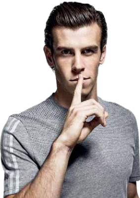
ガレス・ベイル選手