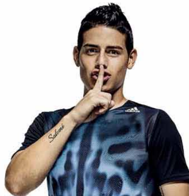
ハメス・ロドリゲス選手