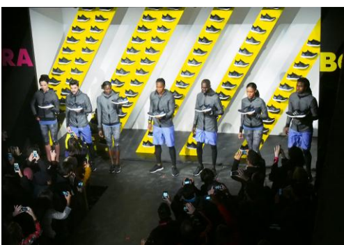
7人のアスリートによるお披露目

さらに、ultra boost を開発した研究開発チーム(adidas innovation team)もブースを展示。分解されたパーツと実験映像を用いて説得力のあるプレゼンテーションが行われ、来場者の方々に実際に素材に触れて、その機能性の高さを感じていただきました。