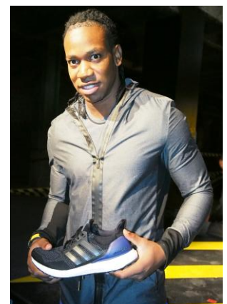
ヨハン・ブレイク