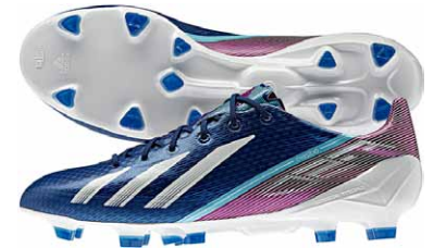
商品番号 G65309 / ダークブルー-F12 × ランニングホワイト × ビビッドピンク S13