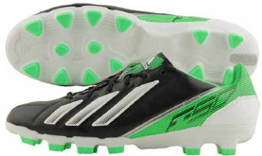
商品番号 Q34777 / ブラック × ランニングホワイト × グリーンゼスト S13