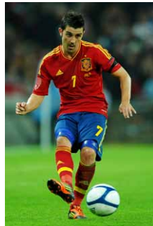
ダビド・ビジャ選手 スペイン代表