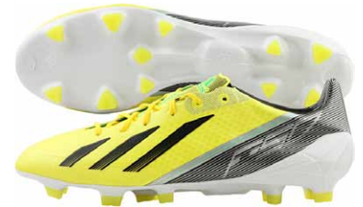
商品番号 G65307 / ビビッドイエロー-S13 × ブラック × グリーンゼスト S13

アディゼロ F50 TRX FG ¥19,845 (本体価格¥18,900) 新テクスチャーを施したスプリントスキンのワンピースアッパーを搭載。 ファームグラウンド(短めの芝と硬めの土)対応モデル。 カラーは2色を展開。サイズ / 24.5~29.0cm