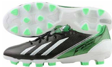
商品番号 G65316 / ブラック × ランニングホワイト × グリーンゼスト S13