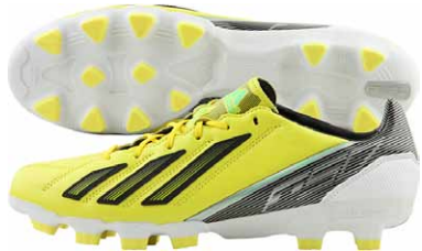
商品番号 G65312 / ビビッドイエロー-S13 × ブラック × グリーンゼスト S13

アディゼロ F50-ジャパン TRX HG レザー ¥18,900 (本体価格¥18,000) ジャパニーズマイクロフィットラストを採用した日本人プレーヤー仕様。ゴ レオレザーのワンピースアッパーを搭載。ハードグラウンド対応モデル。 カラーは2色を展開。サイズ / 24.5~29.0cm