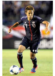
清武 弘嗣選手 サッカー日本代表