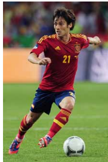
ダビド・シルバ選手 スペイン代表