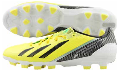
商品番号 G65315 / ビビッドイエロー-S13 × ブラック × グリーンゼスト S13

アディゼロ F50-ジャパン TRX HG ¥18,900 (本体価格¥18,000) ジャパニーズマイクロフィットラストを採用した日本人プレーヤー仕様。新 テクスチャーを施したスプリントスキンのワンピースアッパーを搭載。ハー ドグラウンド対応モデル。カラーは2色を展開。サイズ / 24.5~29.0cm