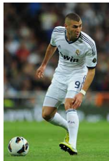
カリム・ベンゼマ選手 レアル・マドリッド所属