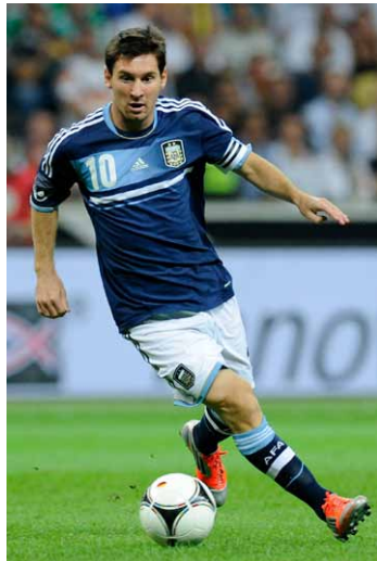
リオネル・メッシ選手 アルゼンチン代表