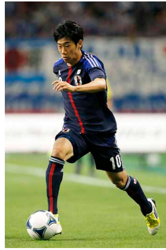
香川 真司選手 サッカー日本代表