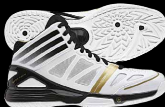
商品番号G48006 ランニングホワイト×ランニングホワイト×メタリックゴールド