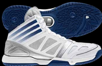
商品番号G49548 ランニングホワイト×ランニングホワイト×ニューネイビー