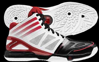
商品番号G48005 ブラック×ライトスカーレット×ランニングホワイト