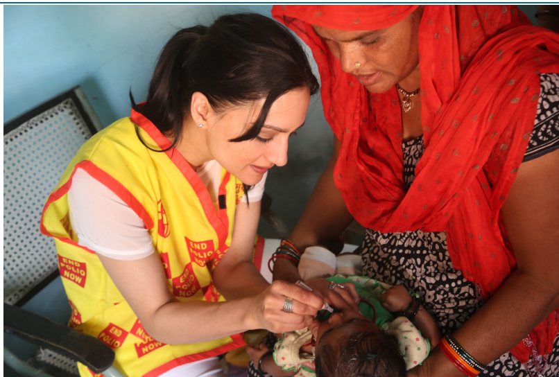
A atriz Archie Panjabi, ganhadora do prêmio Emmy e embaixatriz do Rotary pela erradicação da Poliomielite, imuniza uma criança contra a pólio durante uma visita à Índia em Março 2013.

O Rotary e seus parceiros – Organização Mundial de Saúde , Centro de Controle e Prevenção de Doenças , Fundação Bill e Melinda Gates e Unicef – estão perto de erradicar esta debilitante doença infantil e prestes a fazer história: falta apenas 1 por cento para que a paralisia infantil seja a segunda doença a ser erradicada. No entanto, a pólio permanece endémica na Nigéria, no Afeganistão e no Paquistão e ameaça propagar-se mundialmente se não for contida. Saiba mais sobre o esforço final para obter um mundo livre da pólio e junte-se ao Maior Comercial do Mundo através de uma cabine fotográfica interactiva.