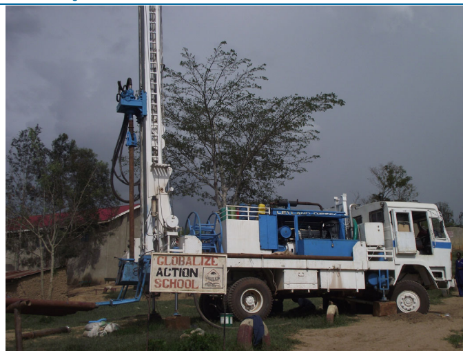
Essa perfuração de poços d'água faz parte do Projeto Alimentício e de Água sustentável Nakateete na Uganda. O projeto ajuda a fornecer água limpa para a comunidade.

Nakateete Sustainable Water and Food Project é um consórcio entre o Rotary Club de Palm Beach WA, na Austrália; e o Rotary Club de Kabale, no Uganda. Este projecto, que começou pela instalação de um poço no orfanato House of Hope Orphanage e na escola de Nakateete em 2010, ajuda os habitantes a reparar poços corroídos e em estados não operacionais. A recente instalação de uma bomba alimentada por energia solar permitiu aos aldeões passar a bombear e canalizar a água até vários pontos diferentes do orfanato e da escola, fornecendo assim água nas cozinhas, possibilitando a irrigação dos jardins e habilitando os balneários dos rapazes e raparigas com água corrente e chuveiros. Este projecto assiste ainda o orfanato House of Hope , a escola Globalize Action Junior School e a comunidade envolvente a gerir o uso da sua nova rede de abastecimento de água de modo a obter um sistema sustentável de fornecimento de produtos alimentares. Os alunos aprendem a cultivar a terra e a produzir alimentos para ajudarem a alimentar os 270 alunos pertencentes a aldeias vizinhas, os 50 órfãos, os 11 professores e ainda os 7 funcionários escolares.