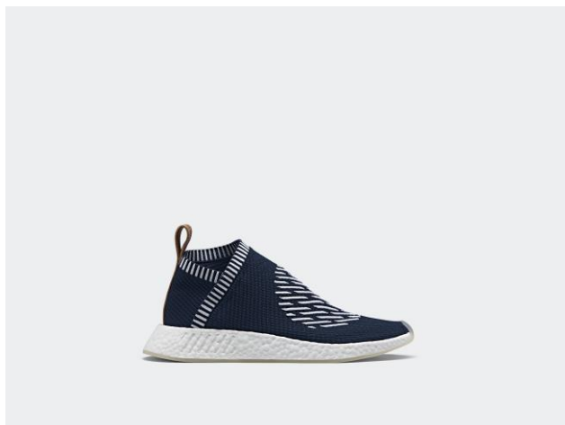
NMD_CS2 PK BA7189 ¥25,000 +税(自店販売価格)