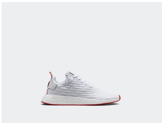
NMD_R2 BA7253 ¥18,000 +税 (自店販売価格)