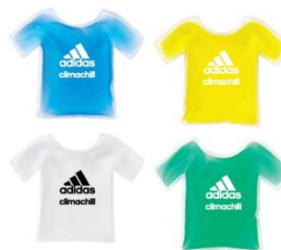
climachill ノベルティ イメージ