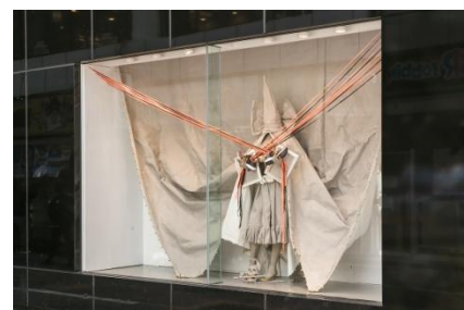
Pyuupiru 「GOD x」