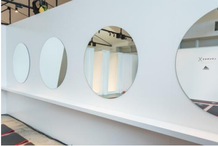
パウダースペース