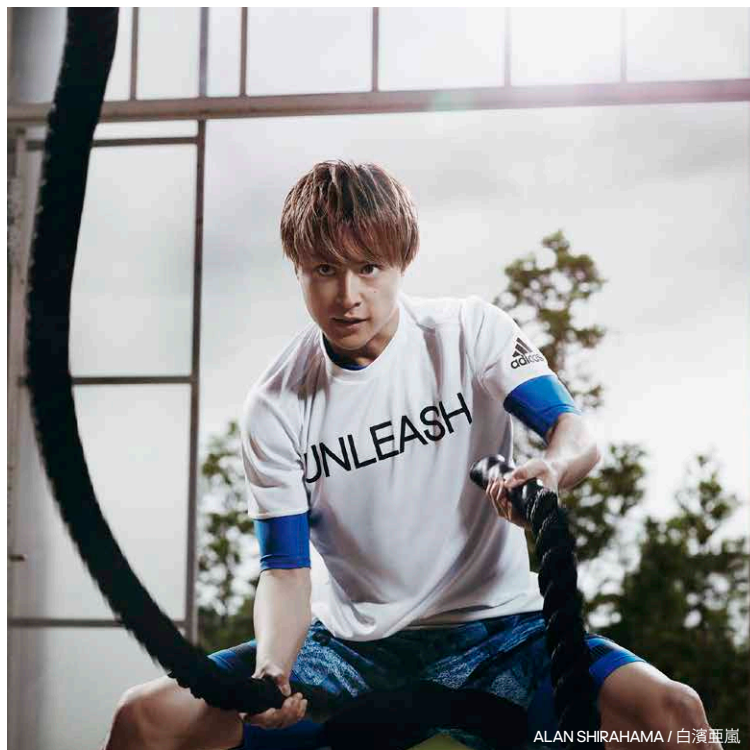
ALAN SHIRAHAMA / 白濱亜嵐