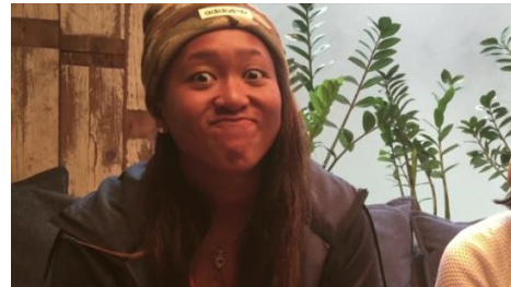
オフに見せるチャーミングな素顔