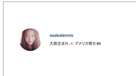
SNSをイメージした動画では、パーソナルな一面