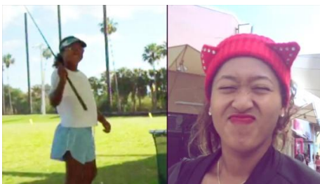
幼少期やプライベートな写真