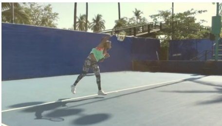
大坂選手の武器であるサーブの練習風景