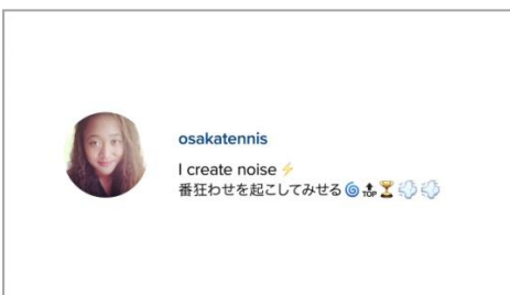
大坂選手の「クリエイター」としての格言