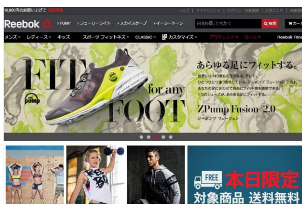
リーボック オンラインショップ Top page

マルチスポーツブランドのアディダス ジャパン株式会社(本社:東京都港区、代表取締役:ポール・ハーディスティ)は、adidasブランドの商品を展開する「アディダス オンラインショップ ( http://shop.adidas.jp/ )」および、Reebokブランドの商品を展開する「リーボック オンラインショップ ( http://reebok.jp/ )」の2つの自社ECサイトにて、総合オンラインストアAmazon.co.jpが提供するサービス「Amazon ログイン&支払い」を2016年3月7日(月)より、国内スポーツ業界では初めて本格導入いたします。