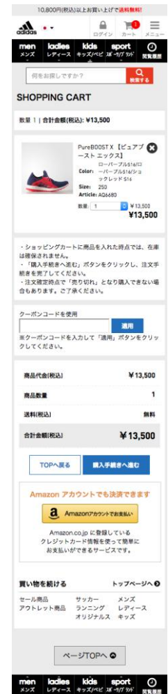
ショッピングカート画面 (スマートフォン)