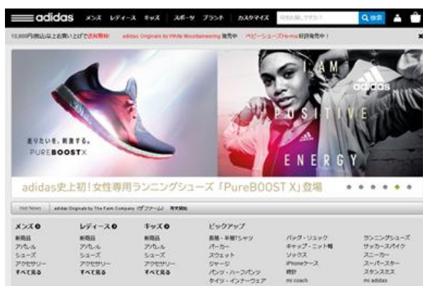
アディダス オンラインショップ Top page