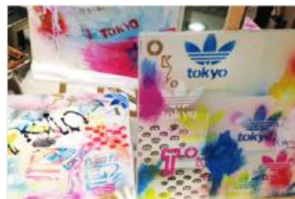
WORK SHOP イメージ

adidas Originals Flagship Store Tokyo にて、お客様ひとりひとりがクリエイティビティを表現できるワークショップを開催。シェルトウをモチーフとしたステッカーやペーパークラフトを用意し、お客様がご自身の手で自由にクリエイティビティを発揮できる場を提供いたします。制作されたシェルトウのアートピースは、美しいインスタレーションとして店頭で展示されていきます。